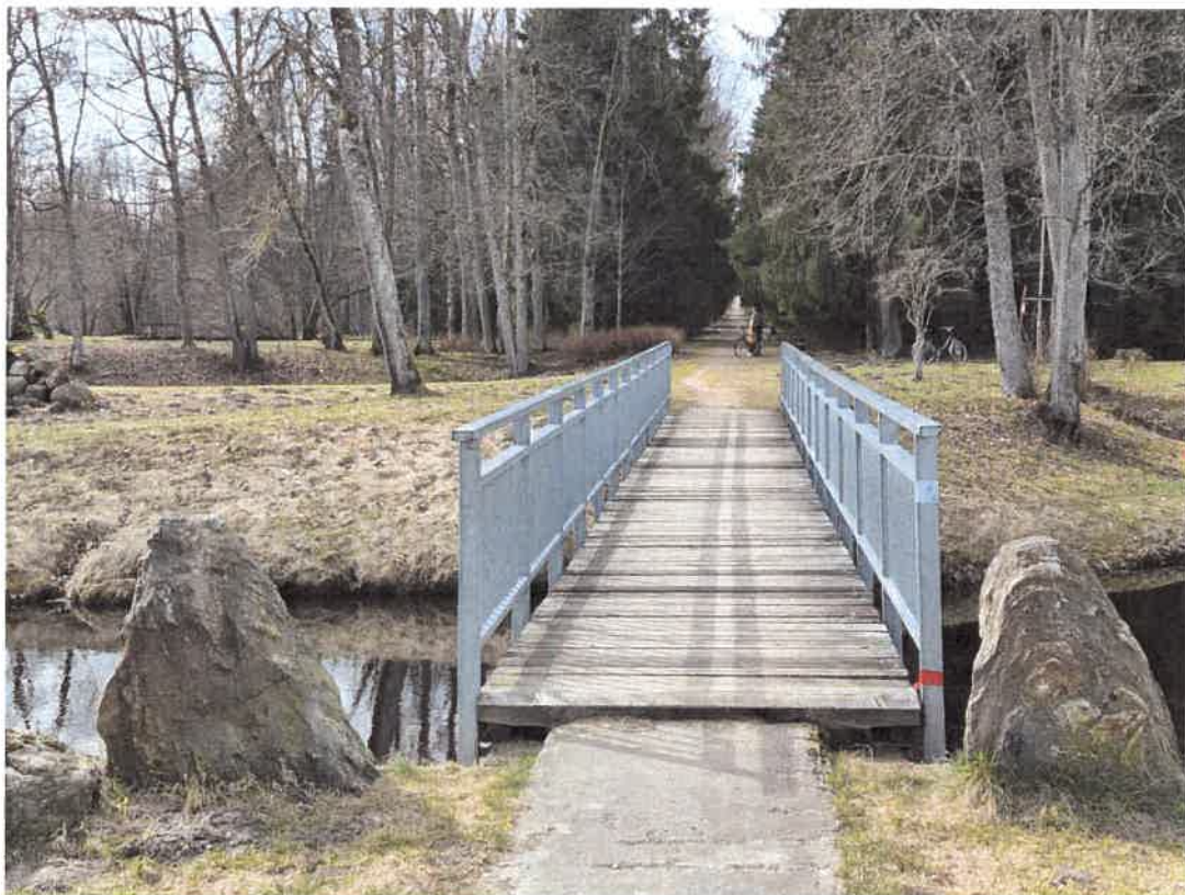
3. Dabartinis tilto vaizdas žvelgiant į parko pusę