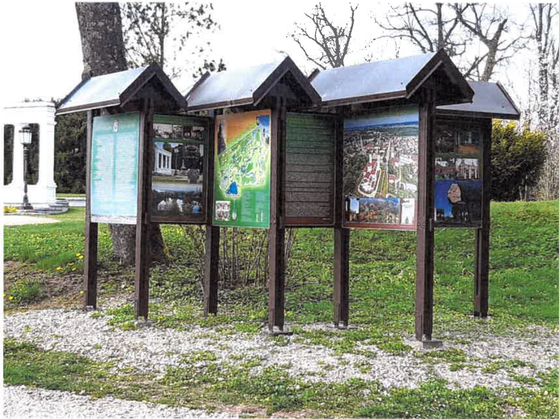
6. Informacinio stendo rūmų parteryje vaizdas