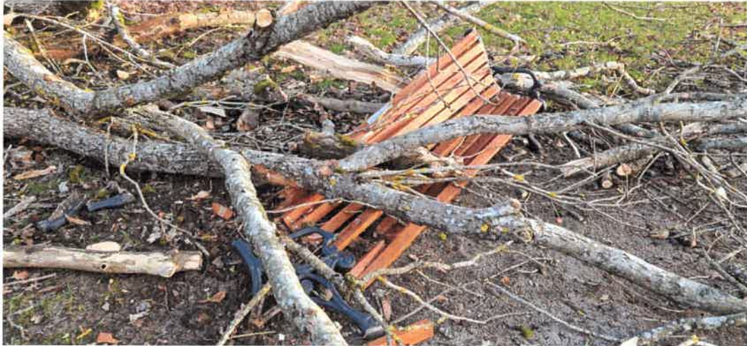
10. 2025 m. rudenį pastatytą vardinį P. Lengvenio suoliuką 2026 m. pradžioje sudaužė griūdamas šimtametis uosis