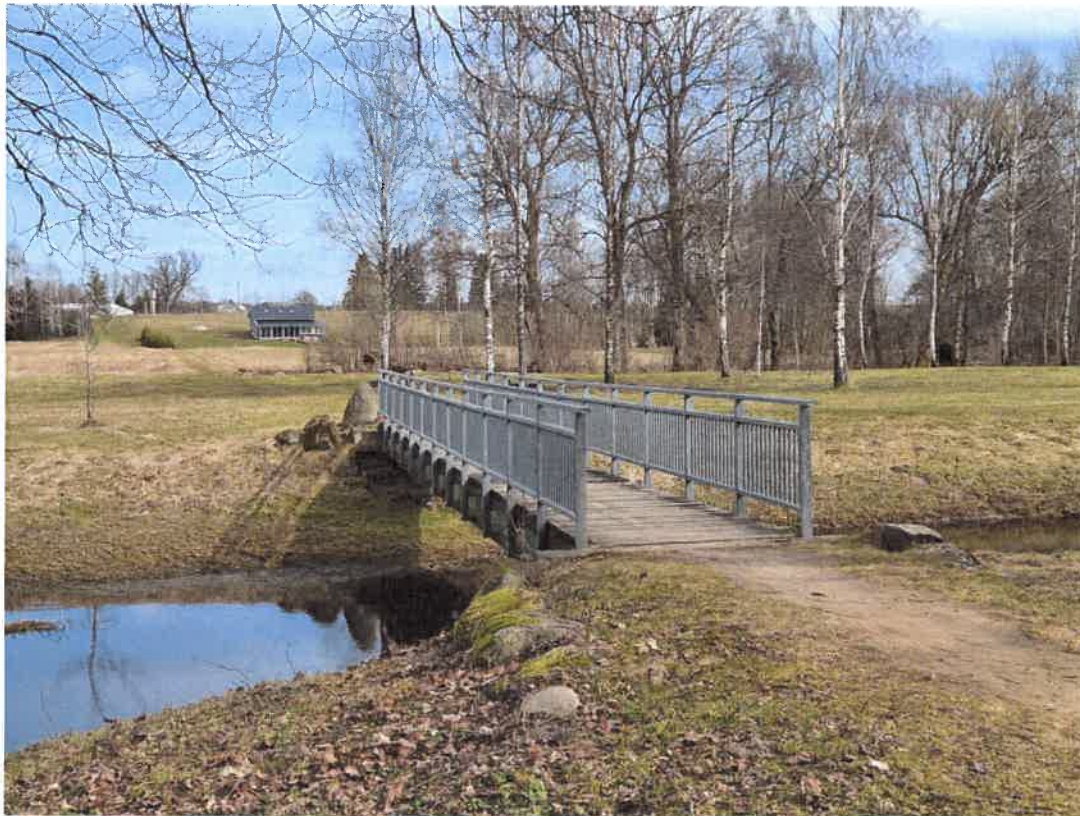
2. Dabartinis pėsčiųjų tilto vaizdas žvelgiant į Vatušių pusę