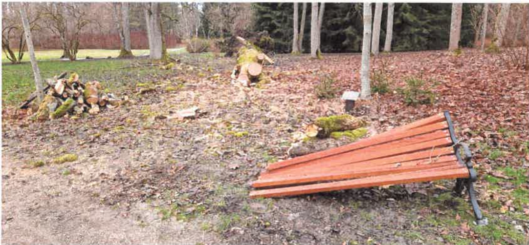
11. Sudaužyto suoliuko vaizdas