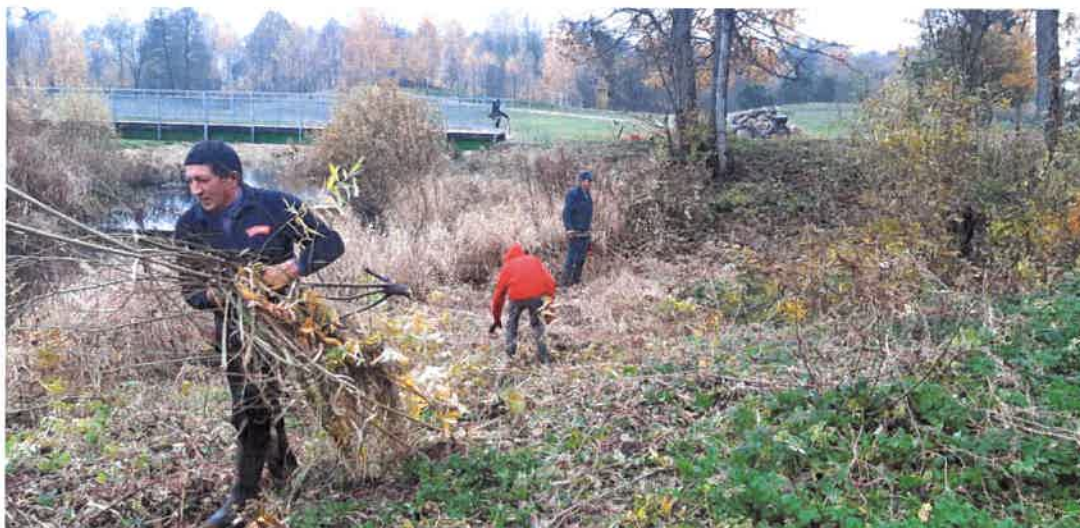
4. Jūros pakrančių tilto prieigose valymas 2018 m.