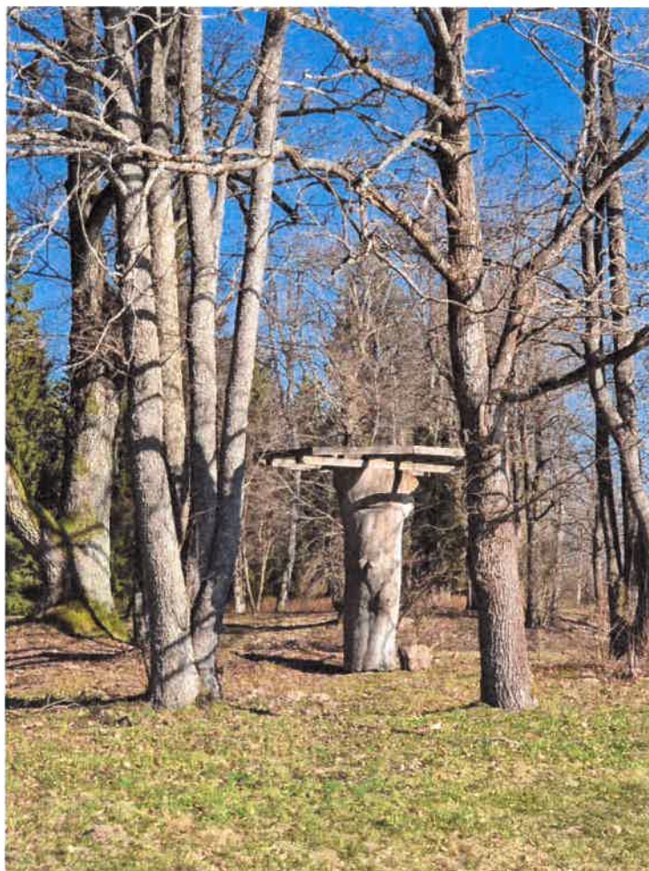
8. Pavēsinēs pagrindo ierengimui panaudojome nudziūvusio uosio kamienā 2023 m. Belieka užbaigti stogo konstrukcijas montavimo ir dengimo darbus