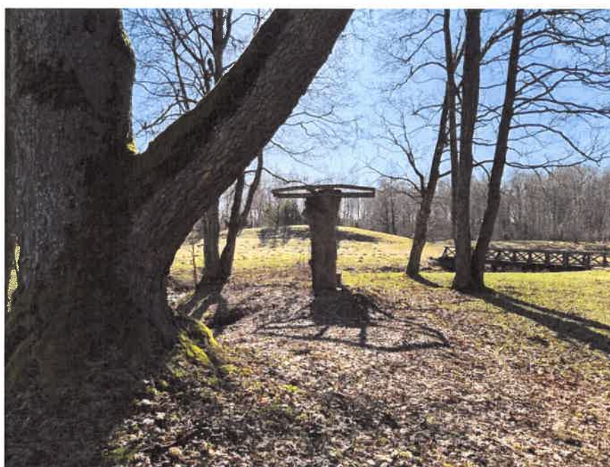
9. Būsimos pavēsinēs vaizdas žvelgiant į pėsčiųjų tiltelio pusę.