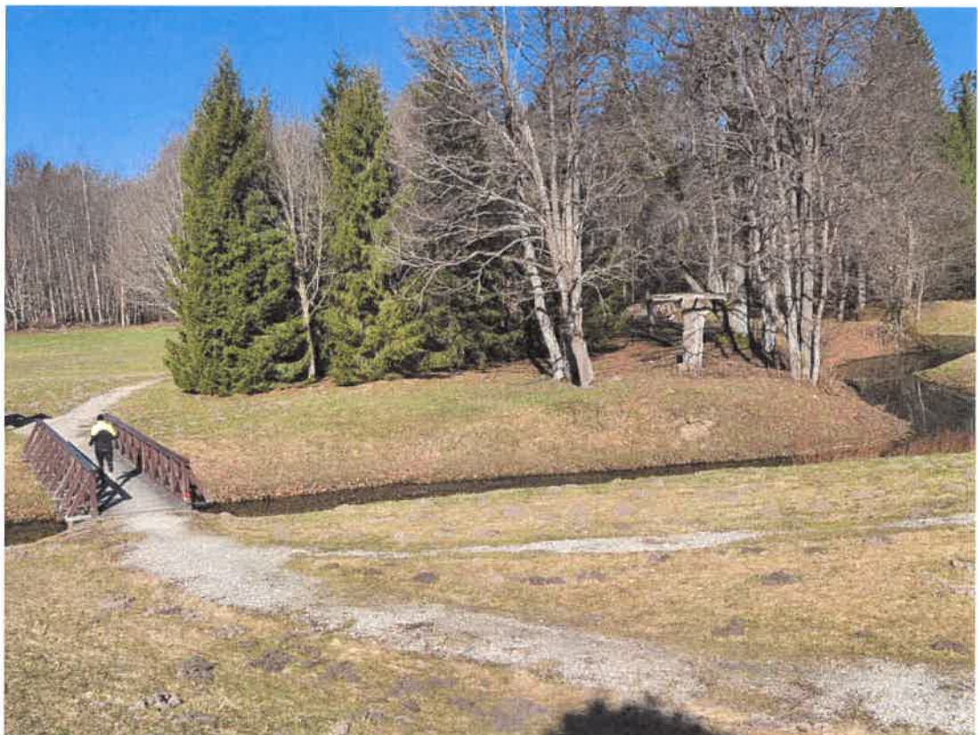
7. Vaizdas į Santakos tiltą ir būsimos pavėsinės pusę