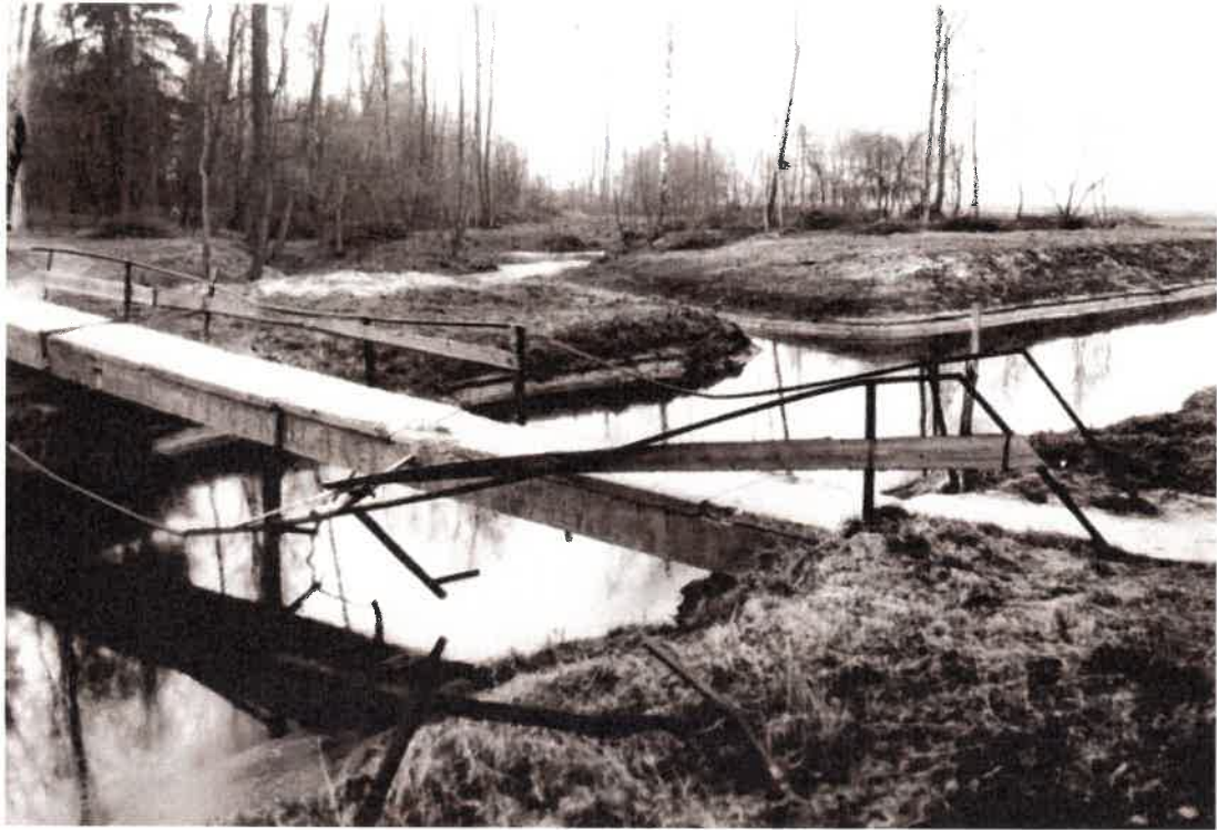
1. Pėsčiūju tilto vaizdas 1985 m.